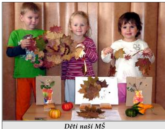
Děti naší MŠ

Starší děti navštívily pohádku "O Palečkovi" v prostějovském divadle.