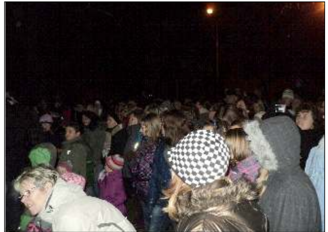
Rozsvěcování stromu - olšanští občané