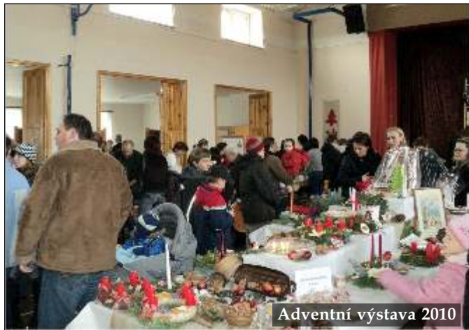
Adventní výstava 2010