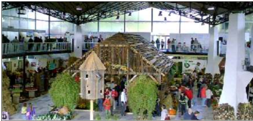
Naši žáci na výstavišti Flora