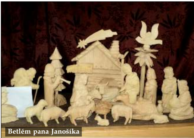
Betlém pana Janošíka