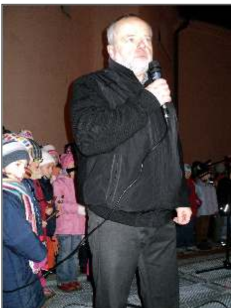
Úvodní zahájení starostou obce