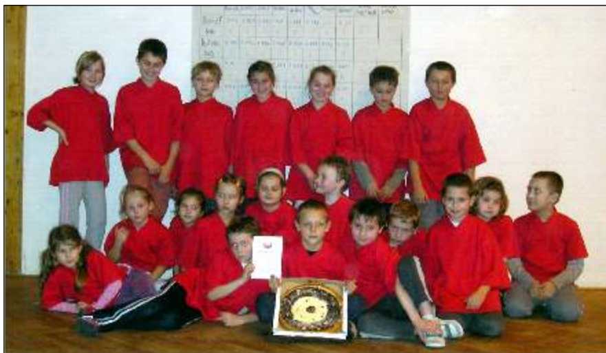
Žáci reprezentující ZŠ Olšany

co se splnilo a na co je třeba se zaměřit. Tento školní rok zahájilo 125 žáků (na prvním stupni 70, na druhém stupni 45), do prvního ročníku nastoupilo čtrnáct žáků, devátý ročník navštěvuje deset žáků. Jim bylo nabídnuto několik zájmových kroužků, které vycházejí z možností školy. Zájem je různý,