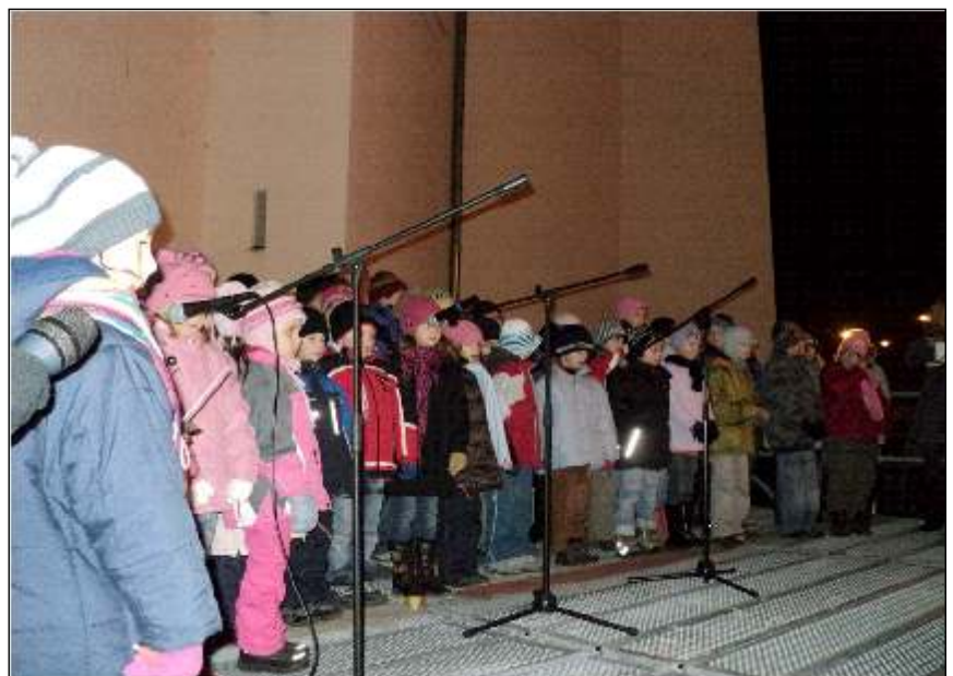
Vystoupení dětí ze základní školy