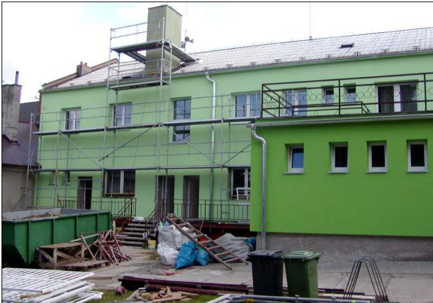
Dvůr obecního úřadu

V letošním roce byl realizován projekt „Zelený ráj Trávníky“. Nejedná se přímo o dětské hřiště, ale je to kombinace výsadby zeleně, dětského hřiště a oddechové zóny pro dospělé. Do této akce se zapojili občané Trávníků a velký kus práce odvedli hlavně zaměstnanci obecního úřadu. Podobný projekt - Dětská zahrada se začne realizovat v druhé