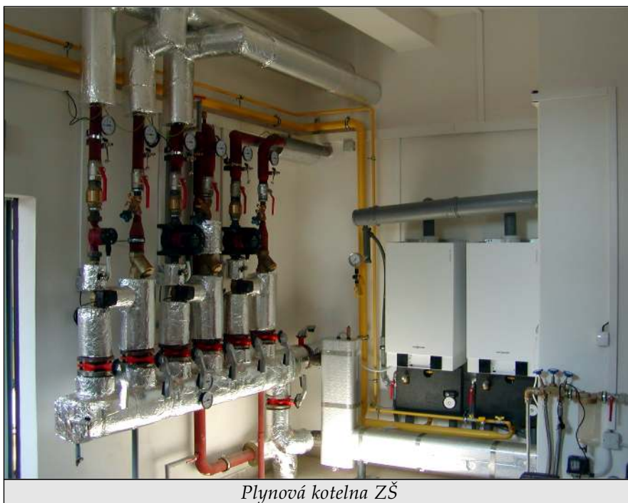
Plynová kotelna ZŠ