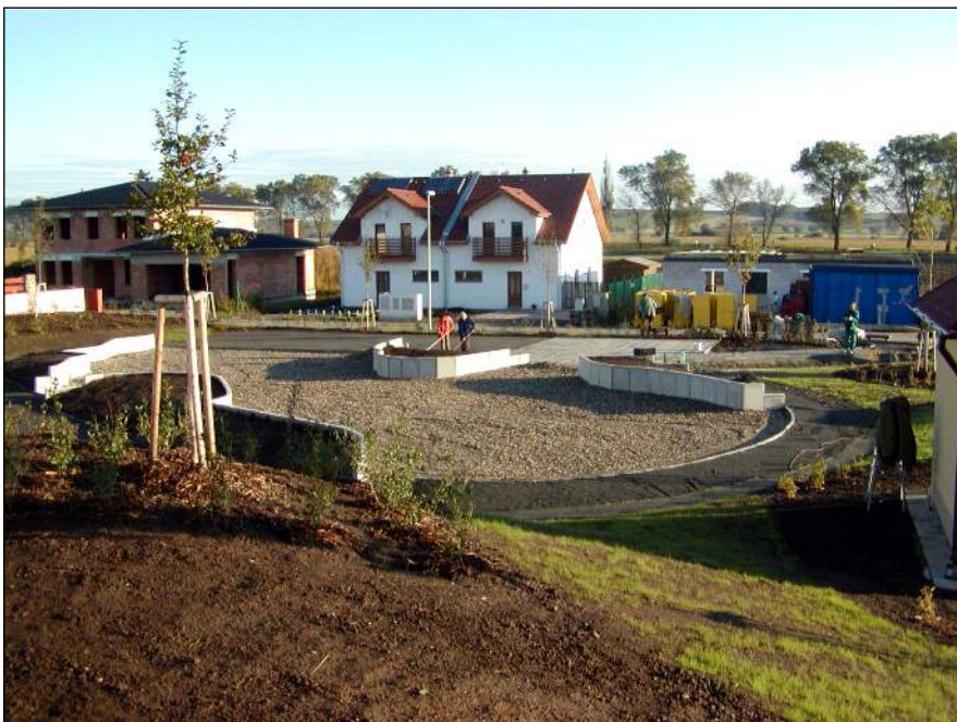
Zelený ráj Trávníky