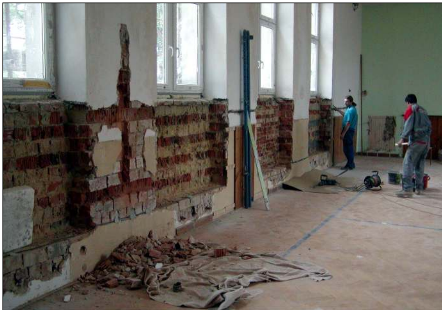
Zapuštění topných těles v tělocvičně

vyměněna topná tělesa v tělocvičně a kvůli bezpečnosti byla i s rozvody zapuštěna do obvodového zdiva. Při pokládání plynovodní přípojky byla současně položena i nová kanalizační přípojka a zrušen velký septik před tělocvičnou, který fungoval spíše jako trativod a způsoboval vlhnutí obvodového zdiva. Po rekonstrukci kotelna obsahuje kondenzační kotle o celkovém výkonu 2 x 60kW místo původních 2 x 250 kW. Celkové náklady plynofikace kotelny a zateplení objektu školy dosáhly částky 5,2 mil. Kč. Výdaje na zateplení obecního úřadu včetně víceprací dosáhly částky 1,8 mil. Kč. Po zateplení budovy OÚ byly