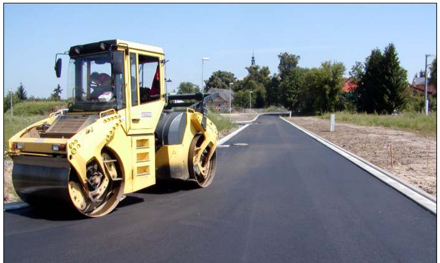
Pokládka asfaltového koberce Za farou

telny. Na výstavbu ZTV Za farou obec překlenovací úvěr zatím nečerpala a stačí průběžně vystavované faktury splácet.