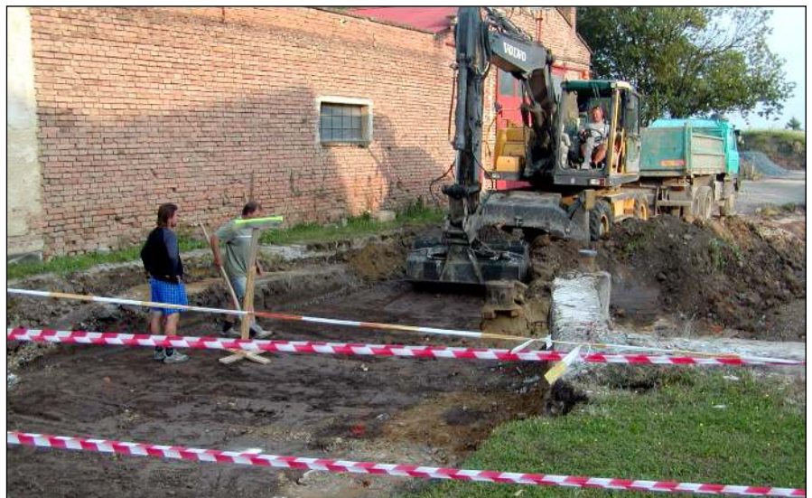
Odstranění stávající komunikace u Kopeckého

Za uplynulé čtyři roky se podstatně rozšířila zastavěná plocha obce a vytvořily se tak podmínky pro další rozvoj obce. Přispěla k tomu výstavba ZTV (základní technické vybavení) v lokalitách Trávníky a Za farou pro 42 resp. 36 RD. Ta patřila k finančně i časově nejnáročnějším investičním akcím za uplynulé čtyři roky. Nejednalo se pouze o samotnou výstavbu inženýrských sítí, ale veškerou administrativu týkající se prodeje stavebních pozemků a následně i vyjadřování ke stavbám RD. V důsledku hospodářské krize a vyšší prodejní ceny se pozemky Za farou prodávají pomaleji, než tomu bylo v případě Trávníků. Jelikož uvedená lokalita je stavebně na dnešní poměry slušně navržena, není třeba se však obávat, že bychom pozemky neprodali. K dnešnímu dni je již schváleno k prodeji 12 st. pozemků a zamluveno 6. Celkové náklady na výstavbu ZTV Za farou dosáhly výše 15 mil. Kč. V tom jsou zahrnuty i náklady, které hradil vlastník soukromého pozemku. Výstavba ZTV Trávníky v roce 2007 dosáhla výše 12 mil. Kč. V obou případech jsme obdrželi příspěvek z Ministerstva pro místní rozvoj v celkové výši 2.370,-tis.Kč. Finanční situaci v roce 2007 (Trávníky) byla obec nucena řešit překlenovacím úvěrem 15 mil.Kč od České spoři-