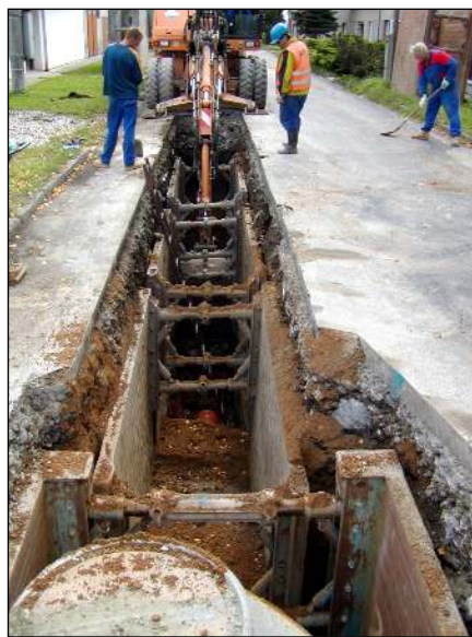
První úsek kanalizace na Hablově

dotacím, které můžeme čerpat až v příštím roce. Dotace poskytnuté ministerstvem činí 55%. Kraj poskytně obci příspěvek přibližně 18% (poskytuje 22,5% dotací na kanalizační řad, na odbočky nepřispívá), zbývající část uhradí obec. Do konce roku bude realizovaná část na Hablově, v příštím roce jakmile to umožní počasí se bude pokračovat na Pijaně. Připojování rodinných domů na kanalizaci (do revizních šachet) bude však probíhat v obou případech až v příštím roce.