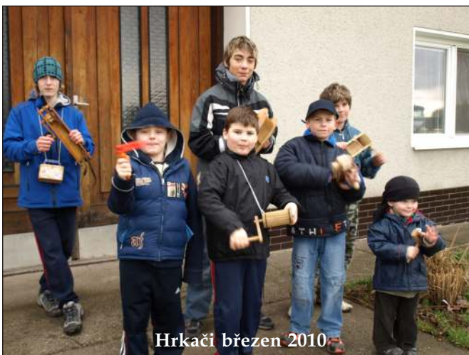
Hrkači březen 2010

Chození chlapců vesnicí s nejrůznějšími řehtačkami a klapačkami v období Velikonoc je další dlouholetou tradicí.