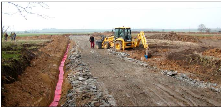
Přeložka vysokého napětí, výstavba plynovodu

Po loňském roce, který se vyznačoval především přípravou projektů a žádostí do různých programů a dotačních titulů, je letošní rok, který je současně posledním rokem tohoto volebního období, pravým opakem. Na straně výdajů musí být obec velmi obezřetná, aby se nedostala do finančních problémů. Uspěli jsme s několika žádostmi z evropských i národních titulů – „Doprůzkum znečištění v okolí obce Olšany a ověření vhodných sanačních technologií“, „Zlepšení tepelně – technických vlastností objektu ZŠ“ a „Zlepšení tepelně – technických vlastností objektu obecního úřadu“. Současně budeme dokončovat výstavbu inženýrských sítí v lokalitě „Za farou“, která byla loni zahájena. Celkové letošní výdaje na dokončení této infrastruktury týkající se pouze obecních pozemků dosáhnou částky přibližně 10 mil. Kč. V čem se situace poněkud změnila, je zájem o stavební pozemky. Ke konci minulého roku bylo evidováno přes padesát žádostí. Při schválení prodejní ceny byli všichni žadatelé osloveni, zda v současné době jejich zájem trvá. Bohužel vážných zájemců podstatně ubylo. Měla na to vliv samozřejmě cena, částečně i schválené regulativy pro RD, ale především přetrvávající hospodářská krize. Proto jsme současně se schválením obecního roz-