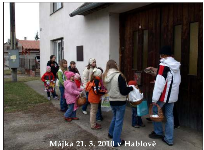
Májka 21. 3. 2010 v Hablově

Lidový zvyk, který se v Hablově udržuje několik desítek let a je předáván z generace na generaci. Děvčata tradičně na Smrtnou neděli obcházejí vesnici dům od domu a před každým zpívají píseň, která začíná slovy Máj, máj, smrtná neděle, kdes tak dlouho byla... Loučí se tak se zimou a vítají jaro do vsi. I letos děvčata pokračovala v této tradici, při které od místních občanů dostávají do košíčků cukroví.