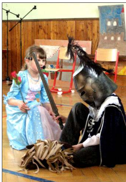
Pohádka o Bajajovi – žáci 2. třídy