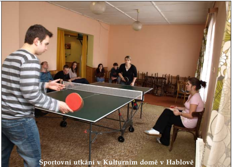
Sportovní utkání v Kulturním domě v Hablově