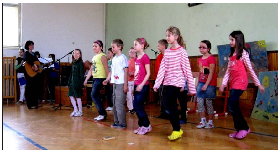
Vystoupení žáků 3. třídy