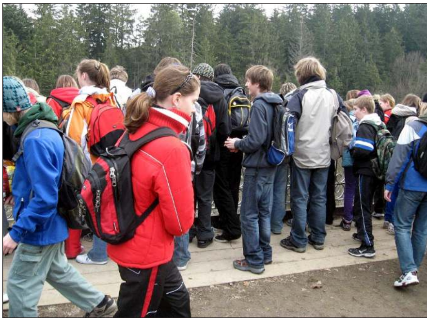
V Moravském krasu

Po prohlídce krásného údolí s říčkou Punkvou jsme se posilnili a zahájili nejzajímavější část exkurze - prohlídku Punkevní jeskyně. Při sdělení informace, že se nacházíme více než 100 metrů pod zemí, se