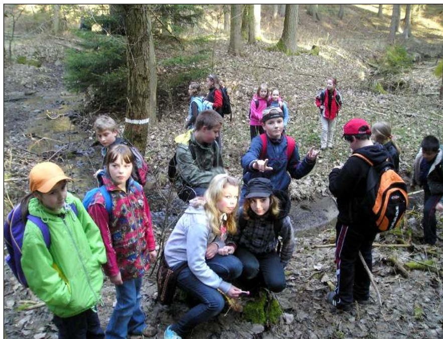
Cesta k pramenu Blaty

Letos naše cesta směřovala do Vilémova. Ráno v 8 hodin, v počtu 45 žáků a 3 učitelů jsme vyrazili vzhůru k zážitkům. Projeli jsme Třebčínem, Slatinicemi, Drahanovicemi až do Náměště na Hané. Zde jsme se zastavili u toku říčky Šumice na okraji Terezínského údolí a pokračovali dál. Olbramice, Vilémov. Přijeli jsme na pole v obci Vilémov, kde jsme nedaleko lesa vystoupili z autobusu. Cestou lesem jsme měli štěstí vidět některé byliny (devětsil, podběl, pryskyřník,...), lesní zvěš se nám však dobře schovávala. Prošli jsme se vyšlapanou pěšinou podél toku říčky Blaty a přes dřevěné lávky jsme došli k pramenu. Děti zde ve skupinkách plnily malý test.