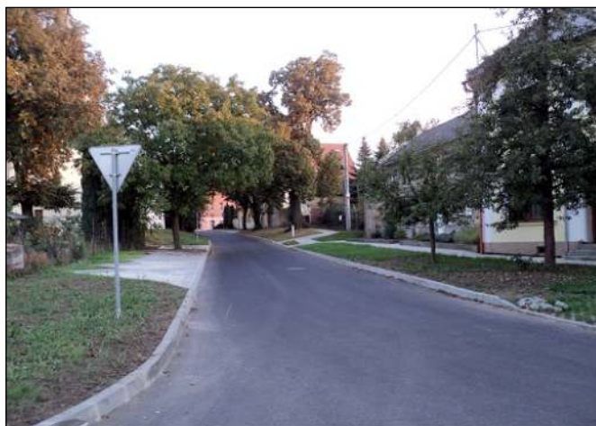
Ulice Pod Kostelem