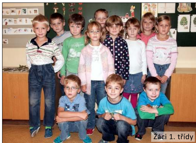
Žáci 1. třídy