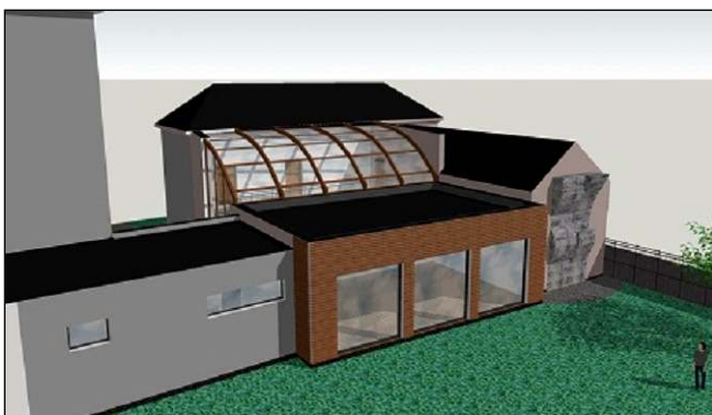
Vizualizace nového oddělení MŠ - zadní pohled

Nové oddělení MŠ bychom chtěli otevřít co nejdříve. Předpokládané finanční náklady I. etapy rekonstrukce objektu předpokládáme ve výši 2,6 mil. Kč.