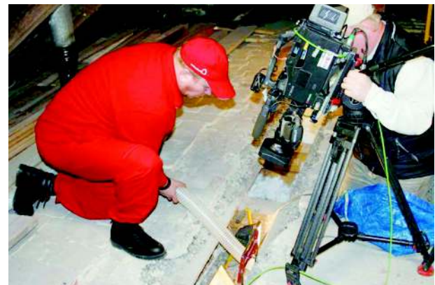
Při natáčení pořadu Rady ptáka Loskutáka - zateplení dutiny trámového stropu

Chcete více informací? Kontaktujte firmu IP IZOLACE POLNÁ, s.r.o. na telefonu 800 100 533 a my vám pomůžeme. Zástupce firmy zdarma přijede až k vám a vše vysvětlí na místě. Poradí, proměří, spočítá kolik by vás to stálo a vy se v klidu rozhodnete. Neváhejte a nečekejte na zdražení energií!