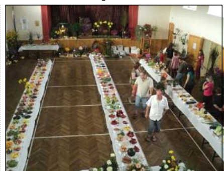
Výstava v místní Sokolovně

První říjnový víkend se zaplnily prostory místní Sokolovny výpěstky ovoce, zeleniny a krásnými balkonovými květinami. ZO ČZS Olšany u Prostějova uspořádala podzimní výstavu, na které bylo vystaveno celkem 337 exponátů. Ty byly dodány od 57 vystavovatelů nejen z naší obce, ale i z Prostějova, Strážova, Čech po Kosířem. Zastoupení mělo také ZD Olšany-Hablov, Soukromí zemědělci Olšany, Semo Smržice. Výstava byla zpestřena 14 druhy drobného exotického ptactva, rybičkami, ba dokonce leguánem. Podívat se přišlo celkem 569 občanů. Výstava byla také doplněna pracemi žáků základní školy, kteří si ji přišli prohlédnout v pondělí 3. října. Jejich výtvarné ukázky byly kladně hodnoceny. Pro návštěvníky bylo připraveno bohaté občerstvení. Tažena