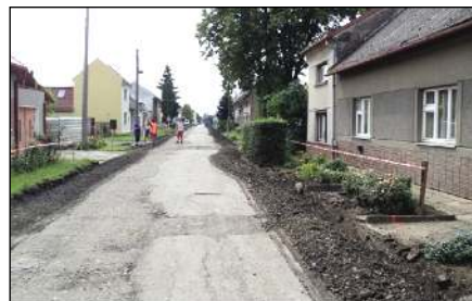
Zahájení 4. 8. 2011

účelu bychom rádi uskutečnili setkání občanů s cílem zapracovat do řešení jejich podněty a připomínky.