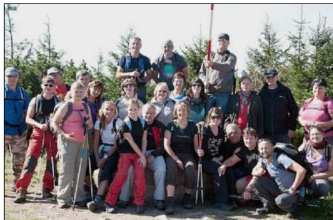
V Orlických horách

O víkendu 23. 9. - 25. 9. jsme pořádali turistický zájezd. Letošní ročník byl v pořadí již osmý. V letech minulých jsme se toulali po slovenských kopcích a tento rok jsme poprvé využili nabídky naší republiky. Naším cílem bylo okolí Říček v Orlických horách. Našich toulek se letos účastnilo 32 turistů. První den jsme podnikli přechod hlavního hřebene Orlických hor od Šerlichu přes Velkou Děštnou a Homoli. Za krásného počasí s výhledy do Polska jsme ušli téměř 25 km. Neděle potom byla věnována prohlídkám zajímavých míst okolí Říček. Z rozhledny na Anenském vrchu jsme měli možnost překontrolovat sobotní trasu. Na cestě do malebné vesničky Neratov jsme se zastavili u tvrze Hanička, která byla součástí obranného opevnění budovaného před II. světovou válkou. S jednotlivými prvky tohoto obranného systému jsme se potkávali celou cestu. Některé z nich jsou již v soukromém vlastnictví, jsou opraveny a jsou v nich instalovány menší muzejní expozice, které seznamují s historií opevnění. V Neratově jsme měli možnost si prohlédnout místní poutní kostel Nanebevzetí Panny Marie, seznámit se s jeho pohnutou