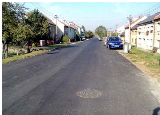
Pijana po dokončení kanalizace