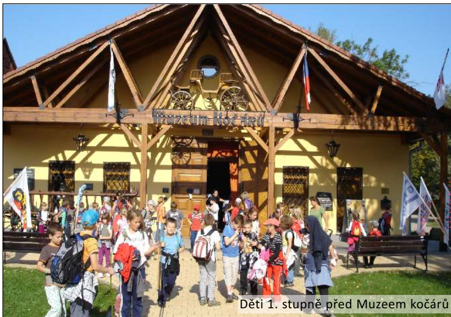
Děti 1. stupně před Muzeem kočárů

Náš výlet, ale ještě neskončil, čekalo nás opékání špekáčků, na které se děti moc těšily. Odpoledne uteklo a na nás