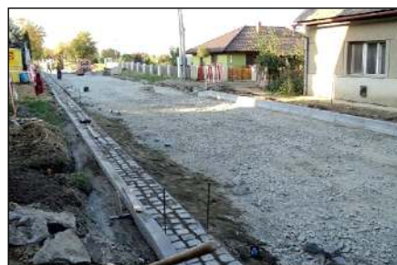
Stav 3. 10. 2011