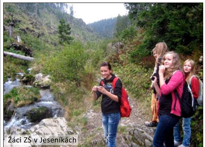
Žáci ZŠ v Jeseníkách