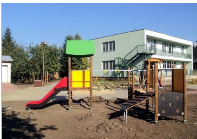
Veselý svět pro zvědavé děti