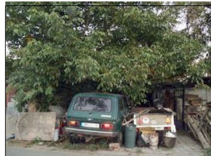
Skládka smetí před obytným domem